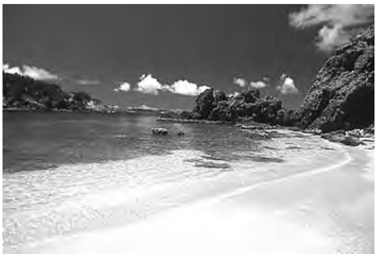
蓬莱根海岸（小笠原村ホームページより）