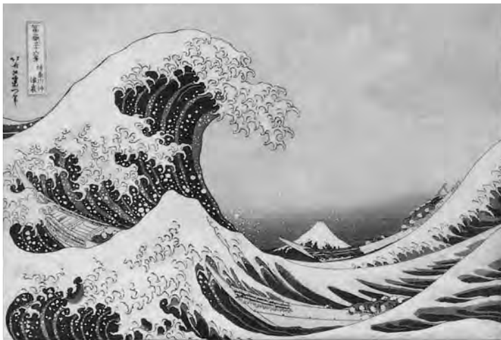
葛飾北斎「富嶽三十六景 神奈川沖波裏」(墨田区蔵)