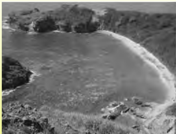
小笠原村「南崎海岸」