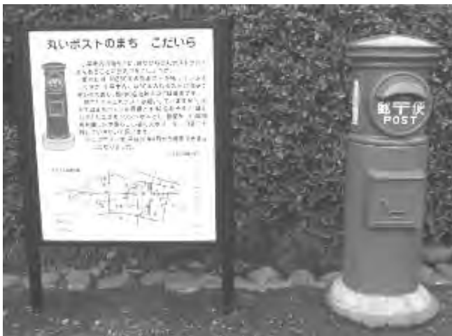
小平市にある丸いポスト