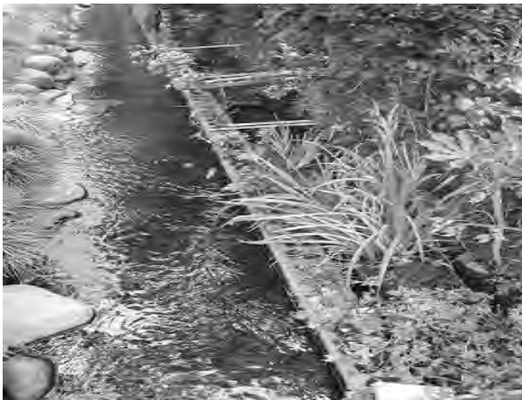
野火止用水