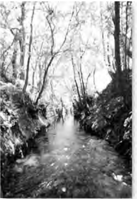
野火止用水