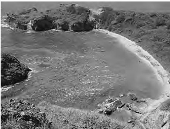
南崎海岸