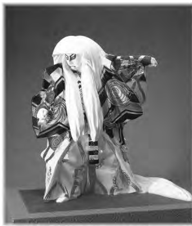
平櫛田中作 鏡獅子