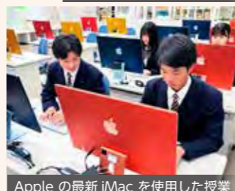
Apple の最新 iMac を使用した授業