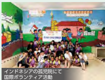
インドネシアの孤児院にて 国際ボランティア活動