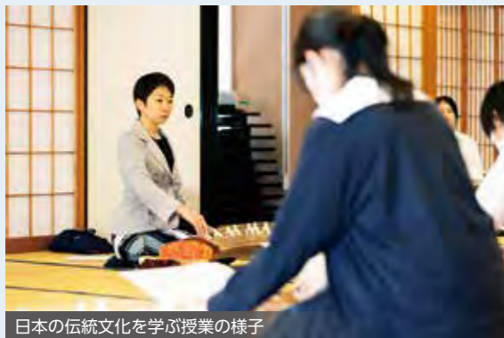
日本の伝統文化を学ぶ授業の様子