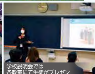
学校説明会では 各教室にて生徒がプレゼン

4年制大学進学希望者が多く、充実した「キャリア教育」、「自分だけの時間割」、「生徒主体で運営する学校行事」、「文武両道」を特徴とした、夢の実現に向けて『自分で学校生活をデザインする』総合学科高校です。