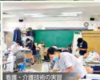
看護・介護技術の実習

「看護・保育・心理」「美術・演劇・音楽」「情報」を中心に、多くの実習科目を設置しています。今まで経験したことのない授業を通して、あなた自身の可能性を磨き、自信を持って輝ける3年間を目指しませんか。