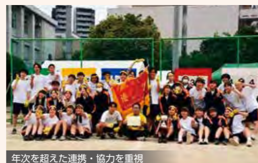
年次を超えた連携・協力を重視