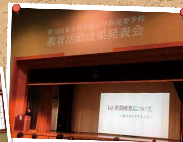
令和4年度 成果発表会(世田谷総合で開催)