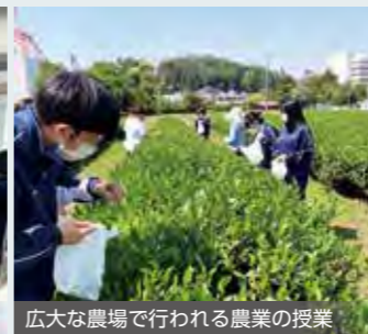
広大な農場で行われる農業の授業

教育目標として「自主」「創造」「探求」「開拓」「貢献」を掲げ「自分でつくる、自分の未来」を実現します。100以上の科目の中から自分で科目を選択することにより、自らの力で進路を切り拓いていくことができます。