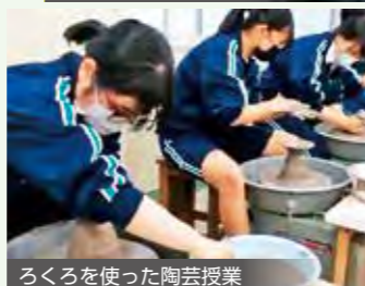
ろくろを使った陶芸授業