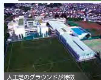
人工芝のグラウンドが特徴