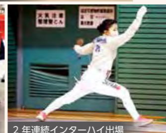
2年連続インターハイ出場

2011年に開校した、校舎も新しい清潔感あふれる学校です。ソウル市の高校と姉妹校締結を結び、ソウルへの修学旅行を実施しています。進路実現に照準を合わせた100科目以上の選択科目を用意し、「Design Your Dream」をコンセプトに、すべての生徒の将来の可能性を応援します。