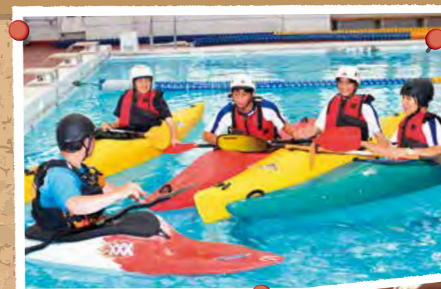
リバースポーツ・校内プールでの練習(つばさ総合)

総合学科高校は、国語や理科などの普通科目から、情報や美術、国際関係などの専門科目まで、自分の興味・関心や進路希望に応じて幅広く学べる高校です。