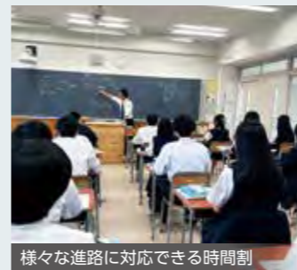
様々な進路に対応できる時間割