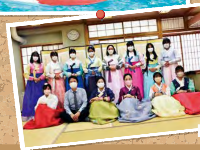
韓国語・韓国文化の授業(町田総合)