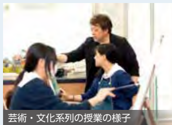
芸術・文化系列の授業の様子