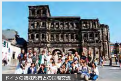
ドイツの姉妹都市との国際交流