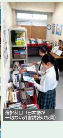
選択科目(日本語が 一切ない外書講読の授業)

多彩な選択科目と計画的なキャリア教育で、生徒一人ひとりの「自己実現」を応援します。また、国際交流がさかんで、海外修学旅行や国際ボランティア活動、姉妹校3校との交流などを実施し、「国際人」の育成に力を入れています。