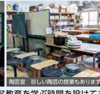
陶芸室 珍しい陶芸の授業もあります

3年間を通じてキャリア教育を学ぶ時間を設けており、その中でグループディスカッションやプレゼンテーション、調査研究の方法を学び、自分で課題を設定して解決するといった学習活動を通して「総合的な学力」の定着と「希望進路の実現」を図ることができます。