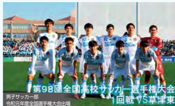
男子サッカー部 令和元年度全国選手権大会出場 第98回全国高校サッカー選手権大会 1回戦 VS 草津東