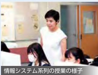
情報システム系列の授業の様子

東京都で初めて設立された総合学科高校で、都内トップクラスの施設をもち、最寄り駅からのアクセスが良い学校です。情報システム、国際ビジネス、語学コミュニケーション、芸術・文化、自然科学、社会・経済の6系列があります。