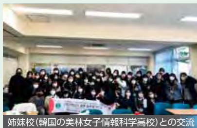
姉妹校(韓国の美林女子情報科学高校)との交流