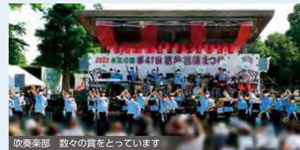
吹奏楽部 数々の賞をとっています