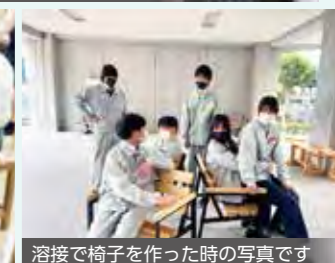
溶接で椅子を作った時の写真です

ものづくりをベースにした国際交流を実施しています。大使館の方と陶芸作りを通して交流したり、イベントに参加したりしています。ダンス部は全国2位の成績を残しています。