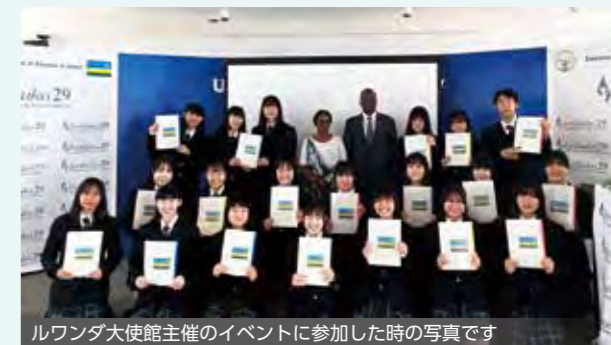
ルワンダ大使館主催のイベントに参加した時の写真です