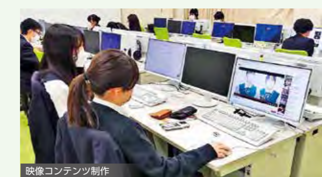
映像コンテンツ制作