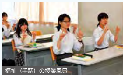
福祉(手話)の授業風景