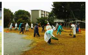
保護者を中心とする大勢のボランティアが砂を伸ばしていきます。