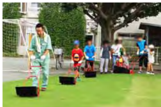
芝刈りの様子。刈り残しがないように連なって刈っていきます。