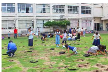
ポット苗をみんなで植付け。参加人数が多いので、活動があっという間に進んでいきます。