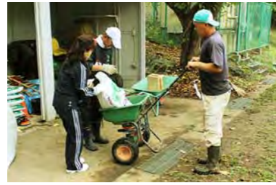
肥料散布機に冬芝の種を入れています。現PTA会長、副校長先生も手伝っています。