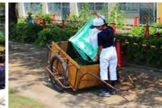
刈草の集草の様子