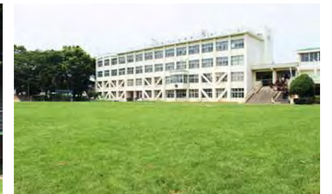
武蔵野小学校の芝生校庭