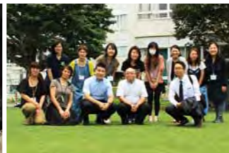
狛江五小グリーンプロジェクトの皆さん