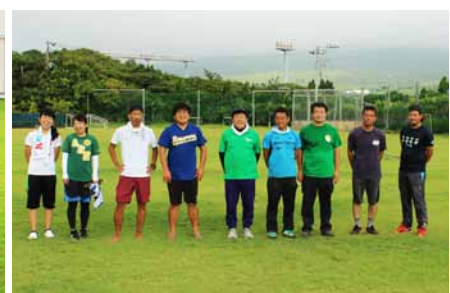
平成29年8月の維持管理活動に参加された先生方と地域の方