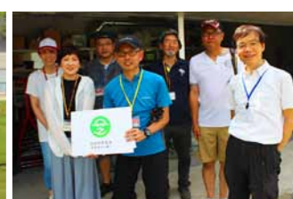
芝生サポーターの皆さん