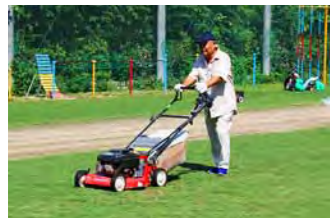
芝生の親方や匠などのエキスパートがエンジン式芝刈り機を使用