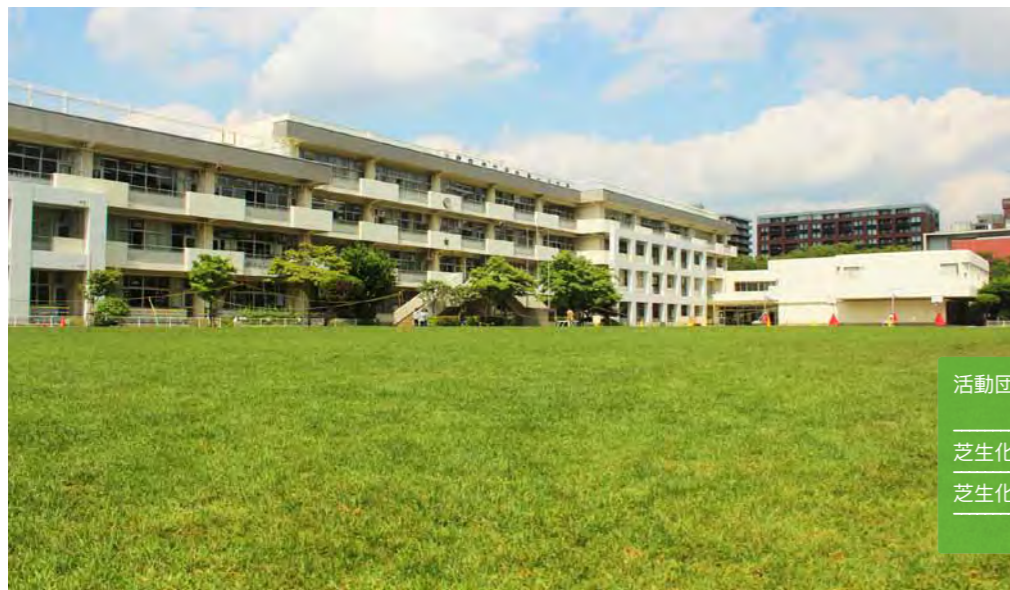
府中第一小学校の芝生校庭