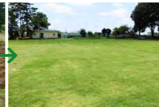
平成 26 年夏の状態。左の写真と同じ場所です。