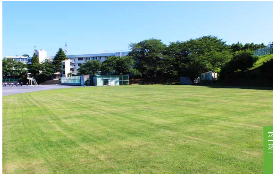
稲城第二中学校の芝生校庭。写真左奥にダスト舗装の校庭もあります。