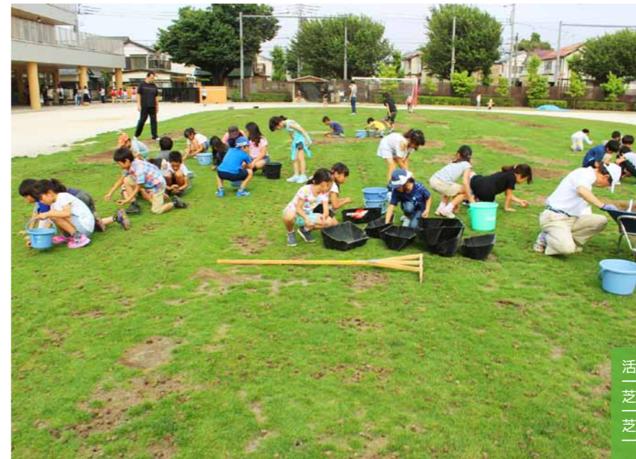
エアレーションにより生じた『芝生のたね』を拾い集めます。