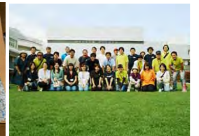
『芝生 de Go』終了後のスタッフの皆さんの補植活動