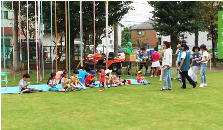
人の確保が難しいお盆に実施されるサマードリームデー。かき氷が目玉!