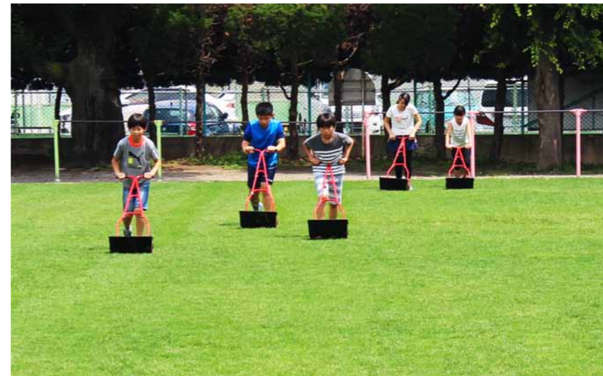
掃除の時間の子供たちの芝刈りの様子