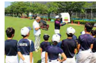
野球の校庭利用団体がリーダーとなって説明している様子