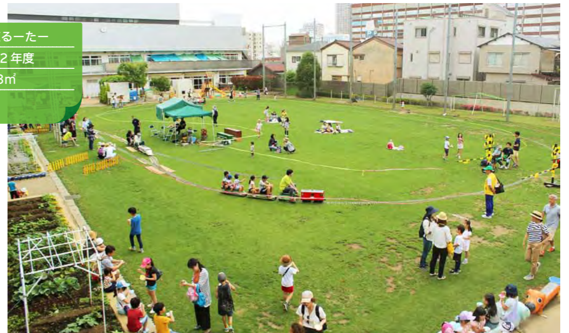
『芝生 de Go』の風景。地域、保護者、学校の皆さんの協力で実施されています。