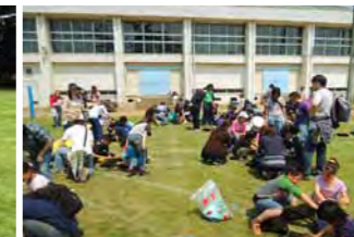
子供たちと保護者が一緒にポット苗を作っています。