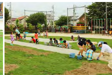
『芝生のたね』をまいた場所に『芝生のバンソウコウ』を敷設します。