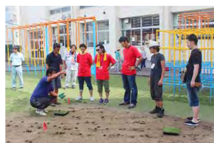
芝生の専門家がパパ隊にポット苗の植え方をアドバイス。パパ隊が子供たちの先生になります。