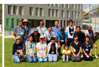
土曜日の維持管理活動のスタッフの皆さん