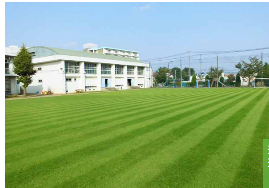
谷戸小学校の冬芝養生明けの状態