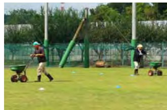
縦方向と横方向に種まきを行い、散布ムラをなくしています。