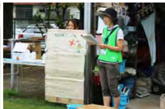
維持管理活動の説明ボードで手順を説明