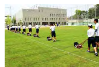
中学部の生徒による芝刈り。先生方がガイドロープを設置してサポートしています。