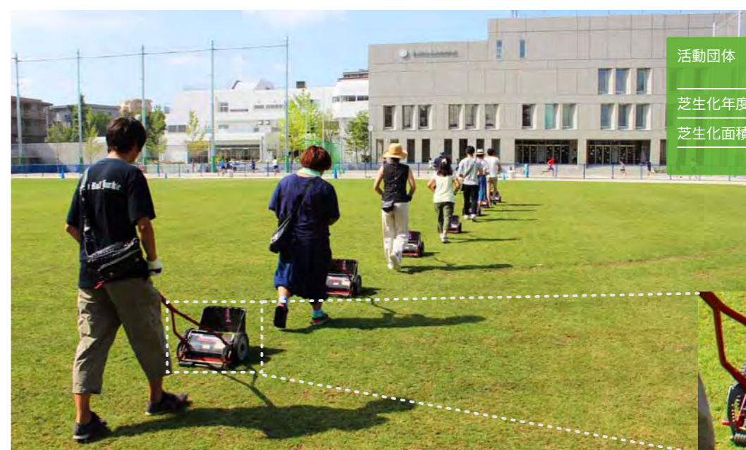
土曜日のボランティア活動による芝刈り