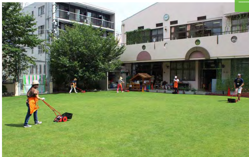
芝刈り日ごとに縦横の刈り込み方向を変えて、刈りムラをなくす工夫をしています。