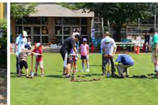
ホールカッターによる補植。早い段階で補植しています。