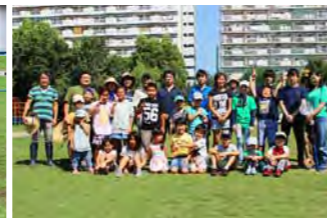
芝生の維持管理活動の後の皆さん