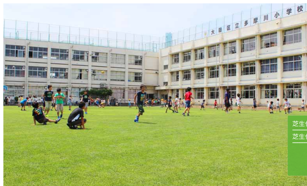
多摩川小学校の休み時間の様子