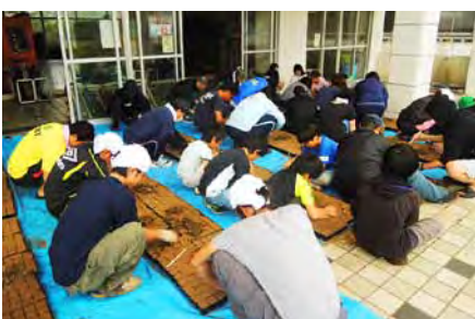
平成25年6月のポット苗づくり。雨でも大勢の人が参加しました。