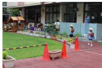
芝刈り時に園児が入ってこないように、活動前に防護柵を設置しています。