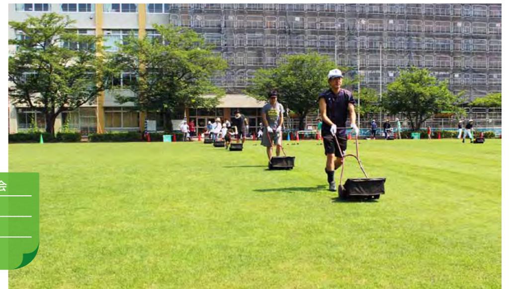
芝刈りの様子。刈り残しが生じないように、芝刈り機の刈幅を重ねています。