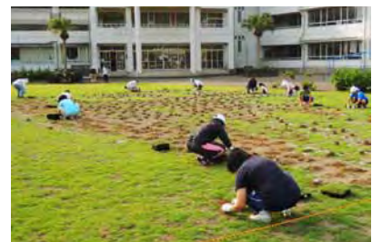
平成25年7月のポット苗補植。大勢の御協力により、約1時間で植え付けました。