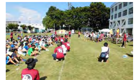
芝生フェスティバルの様子