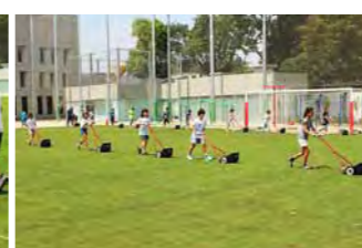
小学部の児童による芝刈り。先生方が子供たちの動きをしっかりとリードしています。