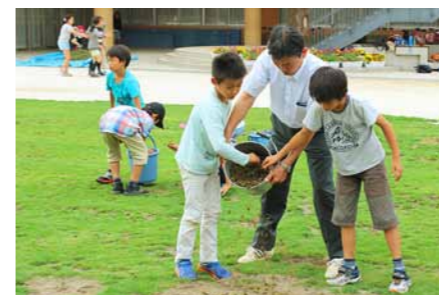
集めた『芝生のたね』を補植地にばらまき。このあと、子供たちが列になって踏み固めます。