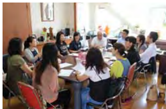
毎月1回、芝生会議を実施しています。