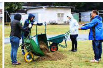
芝生の管理に精通している方が芝管理委員の方々のサポートをしています。