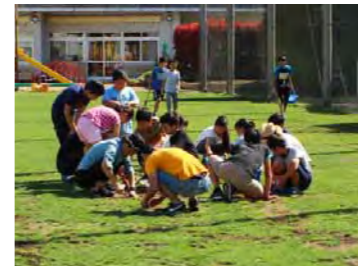
子供たちの栽培委員会と日野芝る一たーの補植活動