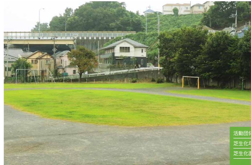
東光寺小学校の芝生校庭。トラック内と周辺部が芝生化されています。