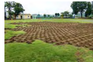
平成 25 年夏の状態