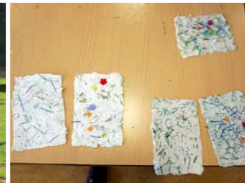
『芝生 de 年賀状』で作られたハガキ