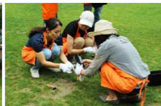
何か見つけたら写真で記録。引き継ぎの資料になります。