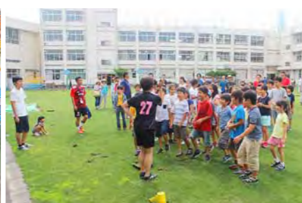
副校長先生のお話。植付け前に、子供たちの気持ちを盛り上げています!