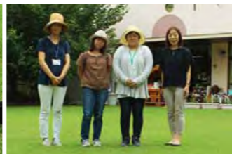
月島幼稚園 PTA 芝生部の部員さんと園長先生。芝生部は、真っ先に希望が埋まる部員制度とのことです。