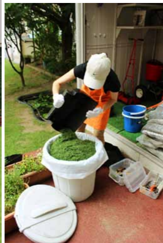
ゴミ袋をポリパケツにセットして、刈草を収集しやすくする工夫をしています。