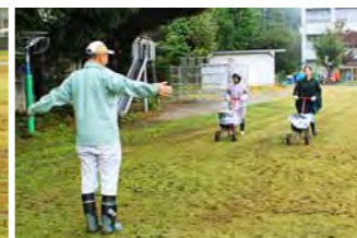
都から派遣された専門家が冬芝の種まきのアドバイスをしています。