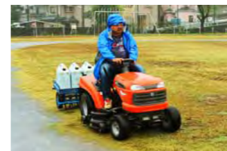
エアレーターを乗用式芝刈り機でけん引してエアレーションを実施