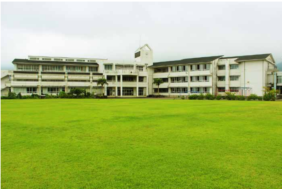
三根小学校の芝生校庭