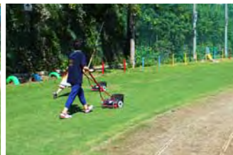
子供たちや保護者の方々は、手押し式芝刈り機で芝刈りします。