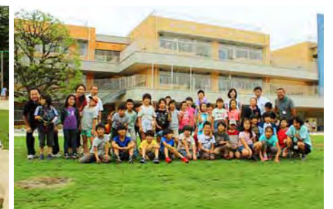
芝生の維持管理活動に参加した子供たちと先生方