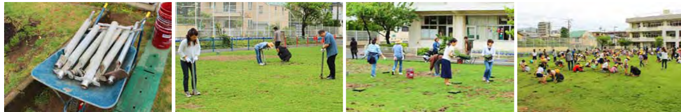
維持管理受託者さんの植穴掘りの道具。迅速な活動の秘訣です。 保護者や芝生ボランティアによる植穴掘りの様子 保護者や芝生ボランティアがポット苗を植付け部に運んでいる様子 子供たちによるポット苗植付けの様子