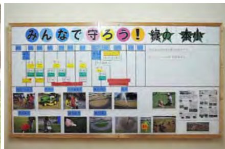
職員室前に掲示してある芝生の維持管理活動の年間計画パネル