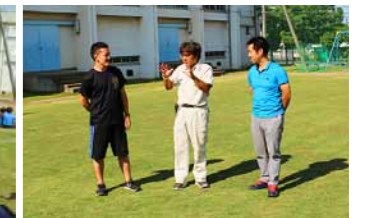
用務主事の方と芝生担当教諭の情報交換の様子