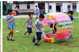
維持管理活動の後の『校庭プレイパーク』。子供たちが楽しんでいます。