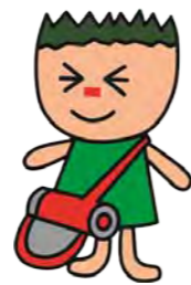
マスコットのしば五郎