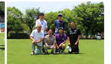
校長先生、副校長先生とGネット委員会の皆さん