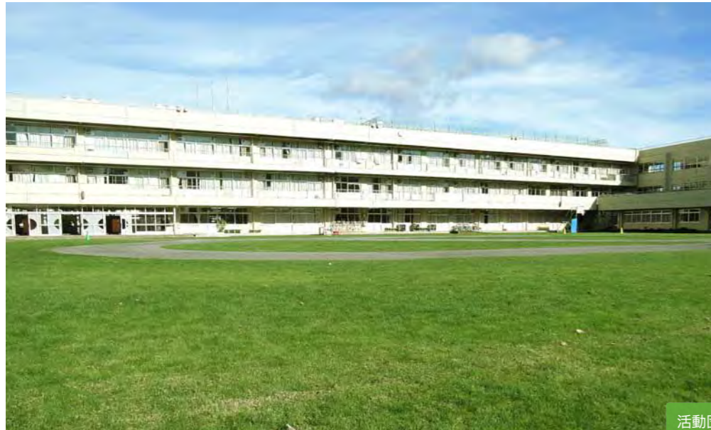
本町田小学校の芝生校庭。走路を抜いた形の芝生となっています。