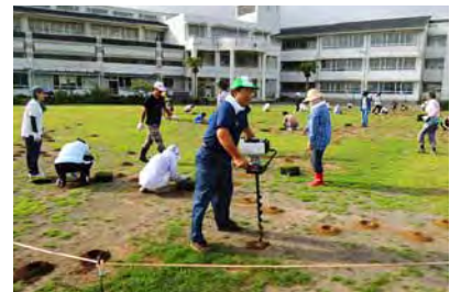
平成25年7月のポット苗補植。植穴掘りはエンジンオーガーで効率化しました。