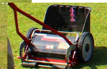
芝刈り機の刈幅の半分を重ねるために、バケットの中央に目印がついています。