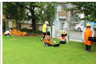
芝刈りの前に、石や小枝を拾いながら、雑草抜きを実施しています。