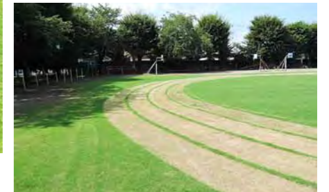
運動会の際の芝生走路。ライン部分の芝生を刈り残し、走路を低く刈ります。