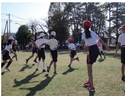
ラグビー交流会の様子