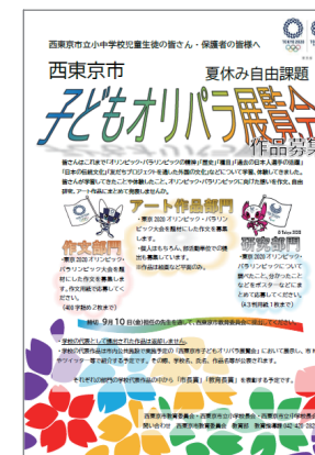
西東京 子どもオリパラ展覧会 の募集チラシ