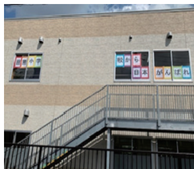
応援メッセージの校舎掲示 全校の校舎に応援メッセージを掲載