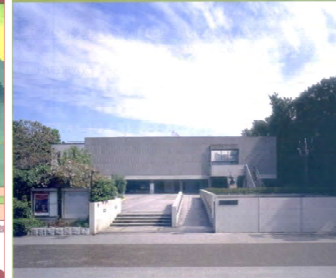
国立西洋美術館 外観