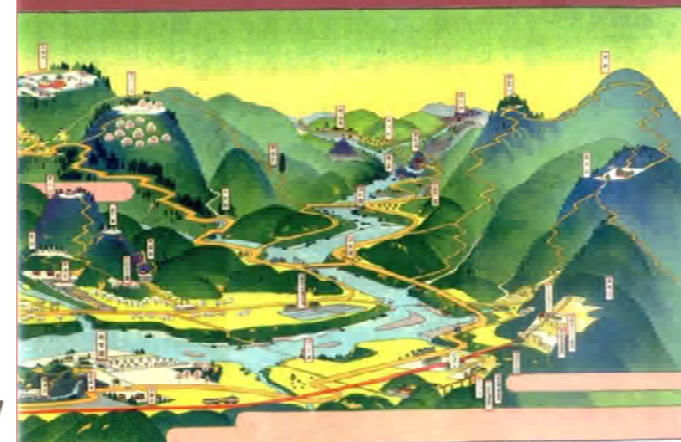
【青梅鉄道沿線名所図説】©青梅市郷土博物館