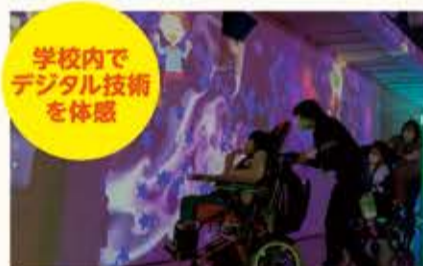
学校内で デジタル技術 を体感