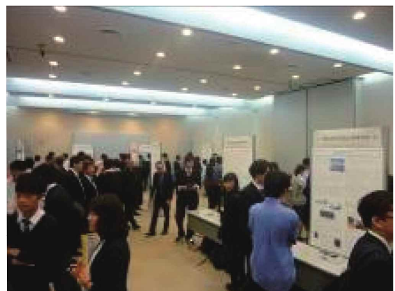
研究発表会でのポスター発表