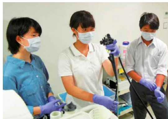
戸山高校：医学部や病院等の見学・体験活動の様子 (左) 大学と連携した採血体験学習 (自治医科大学) (右) 都立病院と連携した内視鏡操作体験 (都立広尾病院)