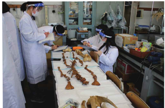
立川高校：実習の様子