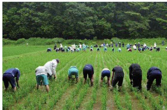
武蔵村山高校：奉仕活動（公園の水田の草取り作業）