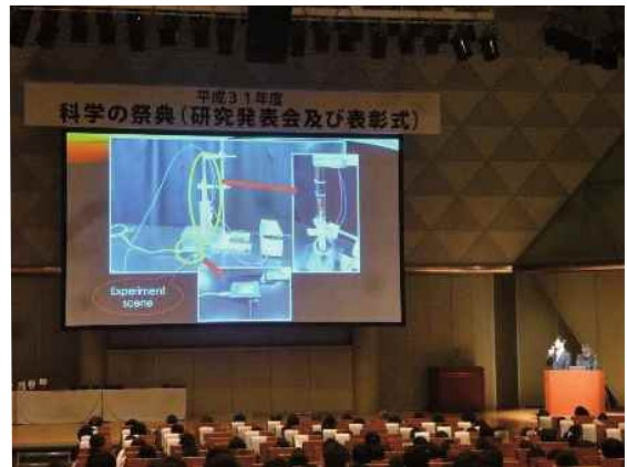
研究発表会での口頭発表