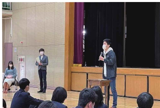
広尾高校：卒業生を招いて進路講話