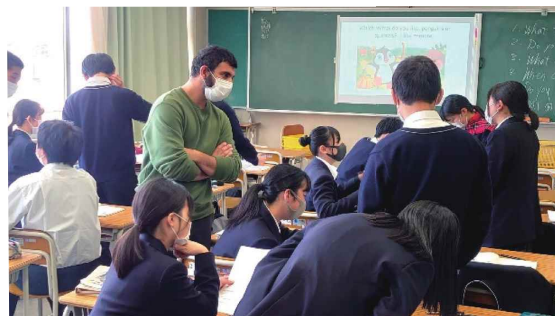
墨田川高校：コミュニケーション英語のグループ学習風景