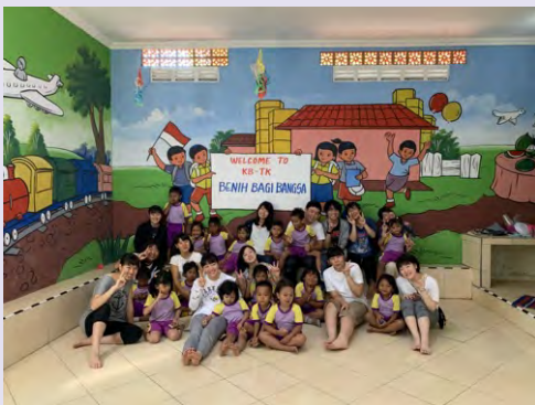
<杉並総合高校：インドネシア孤児院にて国際ボランティア活動>