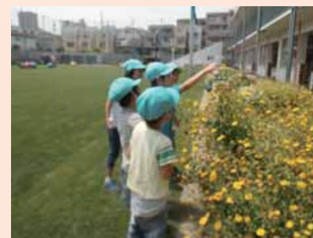
園児たちも芝生の上で積極的に遊びます

保・幼・小の連携を実施している第一日野小学校は、芝生と土の2つの校庭があり、芝生の校庭では隣接する第一日野すこやか園（幼稚園と保育園の一体型施設）の園児たちも一緒に遊びます。