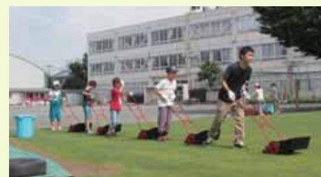
クラス作業による芝刈り

狛江第五小学校は、「みんなで楽しみ、みんなで育てる芝生」という基本理念のもと、学校・地域・保護者が協力して維持管理を行う体制の構築を目指してきました。中心となっているのは、「狛江第五小学校グリーンプロジェクト」です。PTA芝生委員（作業班2名・事務班2名）が実務を担当し、広報誌「しばふ通信」を発行しています。