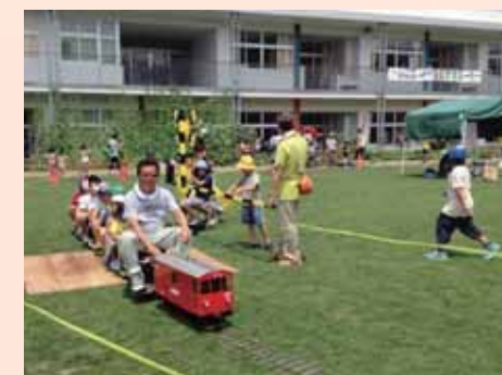
子供たちも大人も楽しい芝生でGO!

直接芝生に触れる機会を通して「地域の芝生」という意識を育むため、芝生の上をミニSLが走る「芝生でGO!」など、子供から高齢者まで参加できる多彩なイベントが続々と開かれています。小さな芝生の種が大きな地域交流の種となっています。