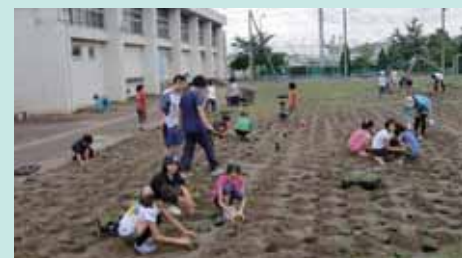
芝生の補修の様子

谷戸小学校は、児童一人当たりの芝生面積が広くないため、全体のうち4割程度の芝生が傷んでしまいました。そこで、平成25年夏以降、専門家のアドバイスを受け、一年後の芝生復活を見据えた計画を立て実践してきました。計画の内容は、専門