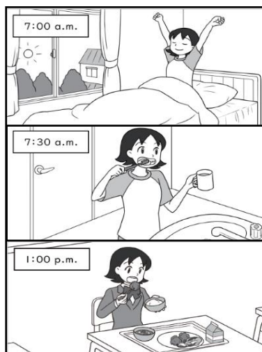
※この画像はタブレットで表示される大きさです。

ひょうげん さいしょ つか かいどう はじ この表現を最初に使って解答を始めてください。