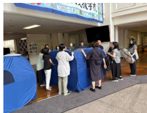
防災体験活動（教職員）

全校児童・生徒が参加できる防災スタンプラリーを行いました。校内の防災設備付近にQRコードを設置。タブレット端末等で読み取ると防災クイズが出題されます。正解するとシールをGET！6枚集めると校長先生から防災マスターの表彰状がもらえます。クイズやQRコードの作成、HPのレイアウトは高等部の生徒が情報の授業で制作。生徒会役員がQRコードの設置を行いました。