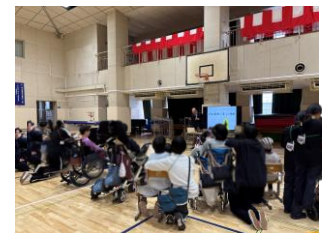
防災体験活動（児童・生徒）

夏季休業期間に実施した教職員による「総合防災訓練」では、児童・生徒の体験活動に先駆け、教職員が地域の防災機関等と連携した体験活動を行いました。防災に関する講習会、防災ゲームの体験、起震車や煙ハウス、構内の防災用品体験など、児童・生徒の安全を守る教職員が実際に体験することで、より安全な避難方法や児童・生徒との関わり方、日頃の心構えなどを再確認できる貴重な機会となりました。