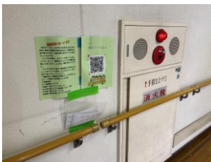
防災スタンプラリー

全校児童・生徒が参加できる防災スタンプラリーを行いました。校内の防災設備付近にQRコードを設置。タブレット端末等で読み取ると防災クイズが出題されます。正解するとシールをGET！6枚集めると校長先生から防災マスターの表彰状がもらえます。クイズやQRコードの作成、HPのレイアウトは高等部の生徒が情報の授業で制作。生徒会役員がQRコードの設置を行いました。