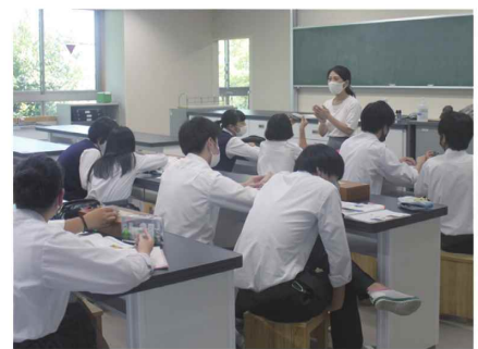
東村山高校: (左) 進路ガイダンスの様子 (ペットトリマーの体験) (中央) 体験学習 (和太鼓) の様子 (右) 授業の様子 (きめ細かな指導を行います。)