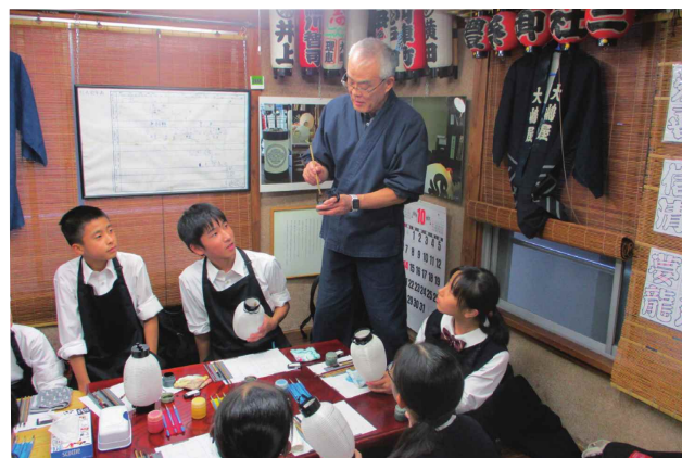
白鷗高校（上）海外研修旅行におけるスタンフォード大学校内の研修の様子 （下）提灯作成における交流を通して特色ある伝統や文化に触れていきます。