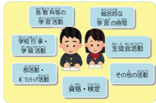
中学校での学習状況や活動状況を整理しましょう。

面接を実施しない高校を志願する場合は、入学手続後に入学する高校へ提出し、入学後の個人面談等で使用します。