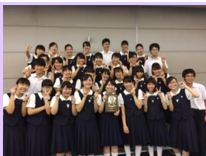
● コンクール表彰式を終えて