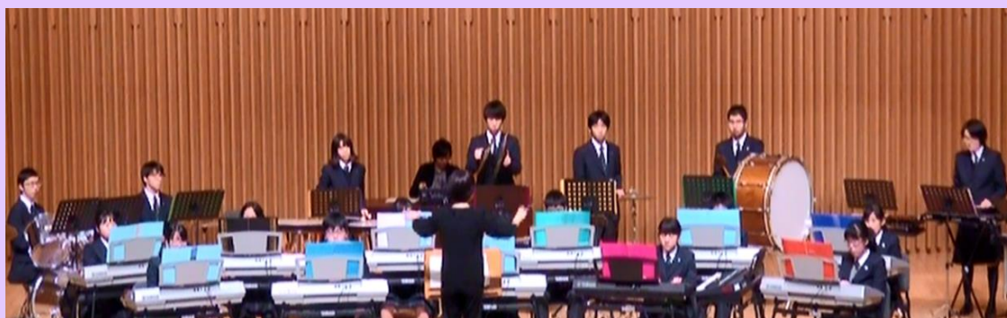
●平成30年度東京都特別支援学校第27回総合文化祭音楽発表会