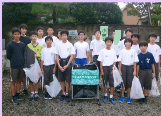
● 地域清掃 グリーンバード作戦