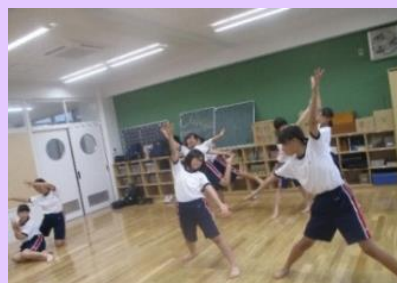
コンタクトインプロビゼーション（仲間と体を接触させ、相手の重さや力の流れを感じながら即興的に踊るダンス）、チアダンス、モダンダンス、創作ダンスなど