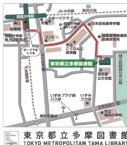
東京都立多摩図書館 TOKYO METROPOLITAN TAMA LIBRARY

東京都立多摩図書館 〒185-8520 東京都国分寺市泉町 2-2-26 TEL：042-359-4020