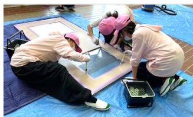
生徒のみで教室ドアを塗装

本校では、夏季休業中に「ペンキプロジェクト」を実施しました。この取組は、校内の老朽化した教室のドアを生徒自身の手で塗り替えるものであり、専門家の技術指導を受けながら、学年を超えて協働的に進めることができました。生徒は、専門家から塗装技術や道具の扱い方を学ぶ過程で、計画性や作業工程の共有の重要性を理解し、チームで役割分担を行うなど、協働的な学びを自然に体験していました。