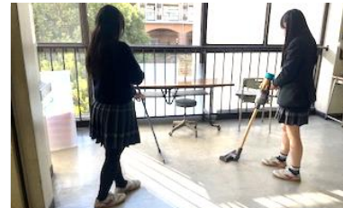
全校清掃強化期間

11月には、生徒主体で追加の塗装作業に取り組む、学んだ技術を自ら活用しながら活動を発展させました。これは「教わって終わり」ではなく、学習した内容を自分たちだけの力で応用・実践するという、高校生に求められる探究的な学びの姿につながる取組です。また、仲間と協力しながら試行錯誤する過程を通じて、コミュニケーション能力やリーダーシップなど、社会で求められる資質・能力の育成を図りました。