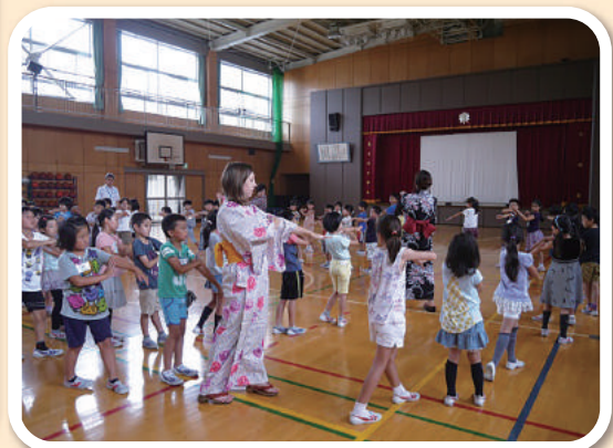
伝統文化教育（大田区立洗足池小学校）