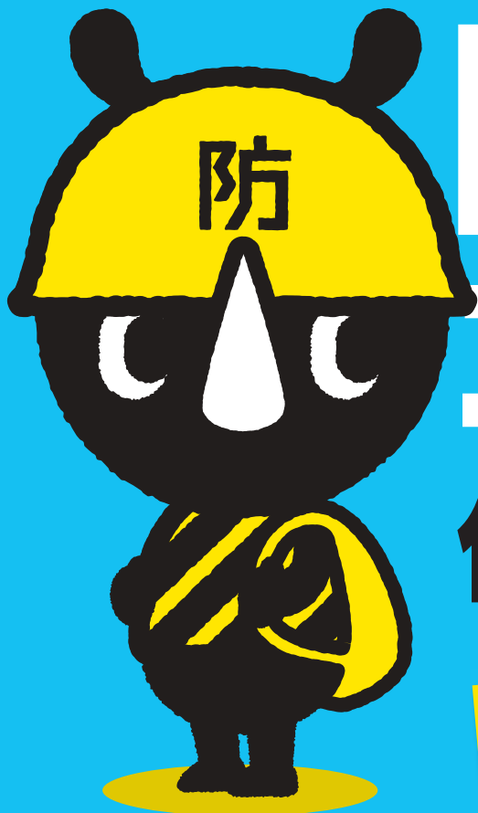
東京防災公式キャラクター 防サイくん