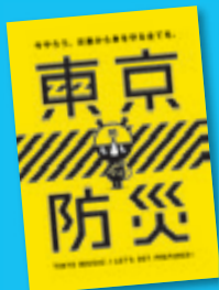
東京都発行「東京防災」