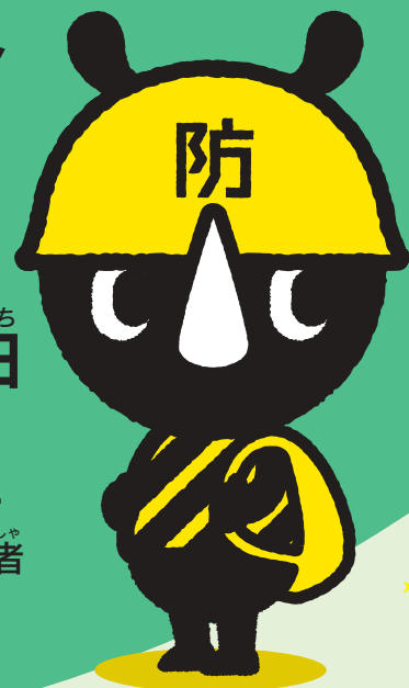
東京防災公式キャラクター 防サイくん