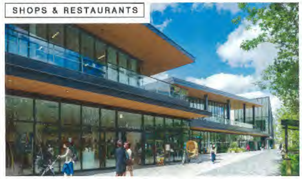
SHOPS & RESTAURANTS

街区の中央にある約10,000㎡の広大な広場 この広場は、噴水や芝生、ピオトープがあり、オフィス利用者や来街者の憩いの場になる他、様々なイベントの開催を通して、人とまちをつなぐ重要な役割を果たします。