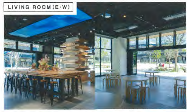
LIVING ROOM (E-W)

地域・施設・人のつながりを生み出す「まちの縁側」 緑と水があふれる広場を中心にした、開放的なショッピング空間。まち歩き楽しさと、心地よい体験をお届けします。