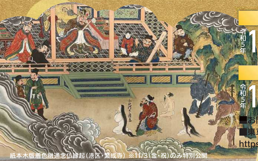
紙本木版着色融通念仏縁起(港区・繁成寺) ※11/3(金・祝)のみ特別公開