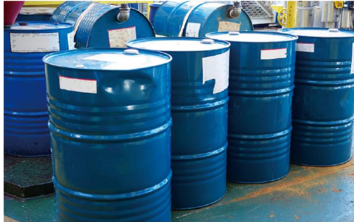
石 ゆ 油