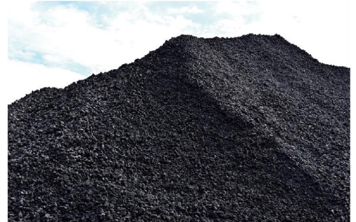
石 たん 炭