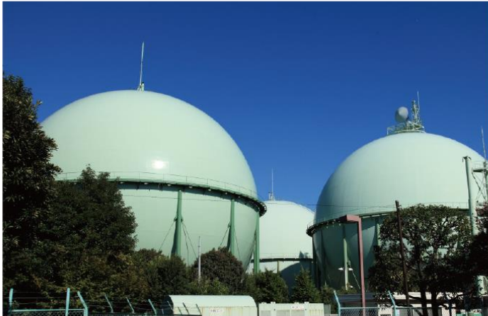
天然 ねん ガス