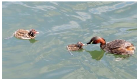
小魚をあたえる親鳥