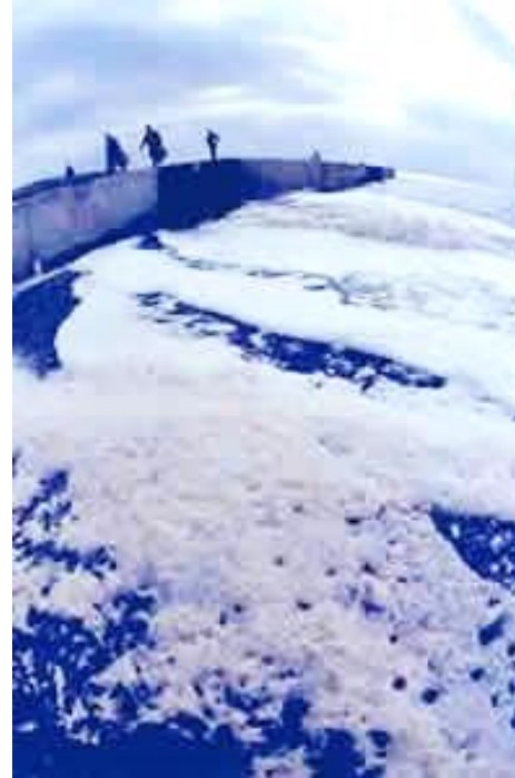
海にただようあわ