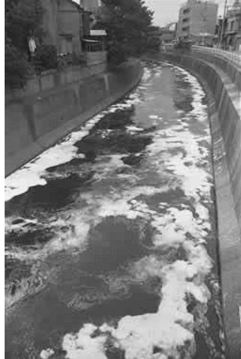
川にただようあわ