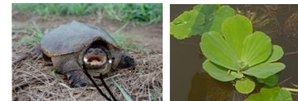
左上：アライグマ 中央上：ブルーギル 右上：ヒアリ 左下：カミツキガメ 右下：ボタンウキクサ