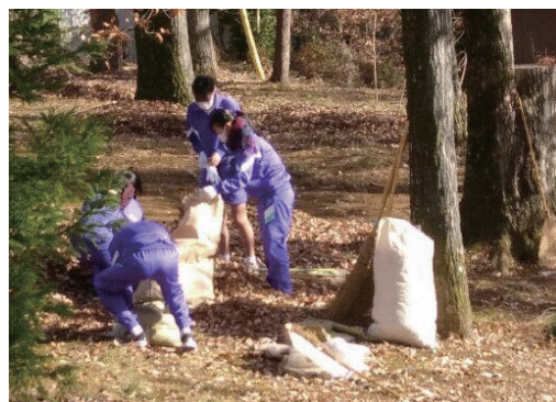
地域清掃ボランティア