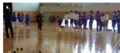
ボッチャ体験授業