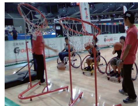
車いすバスケットボール体験会