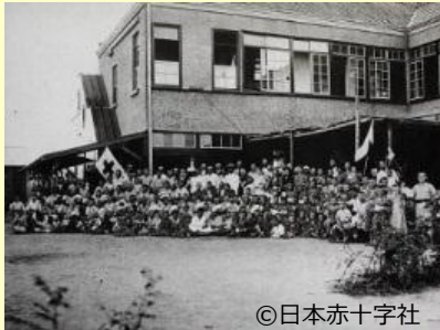
施設に收容された孤児たち（大阪）

ポーランドは伝統的な親日国としても有名で、日本と様々な交流を行っています。このような親密な交流は、いつ頃から続いているのでしょうか。