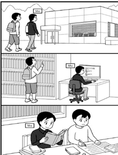
※この画像はタブレットで表示される大きさです。

もんだい じゅんぴ じかん びょうかん ろくおんかいし おと な かいとう はじ かいとうじかん この問題の準備時間は30秒間です。録音開始の音が鳴ってから、解答を始めてください。解答時間は50秒以内です。