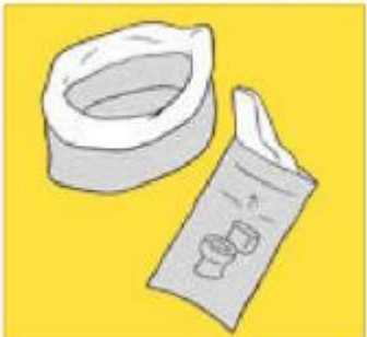
下水道の使用ができない場合