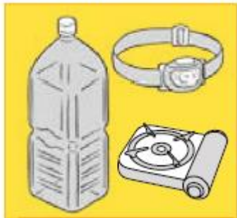
ガス・電気・水道の代替