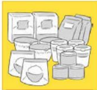
食料品や日用品の備え