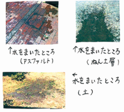
↑水をまいたところ (アスファルト) ↑水をまいたところ (ねん土層)

方法 緑野小学校のヒマヤロード(アスファルト)、校庭のすみ(ねん土層)、桜の木の下(土)で打ち水をし、地面の温度、気温を調べる。高さは同じ。まく水の量は2L。