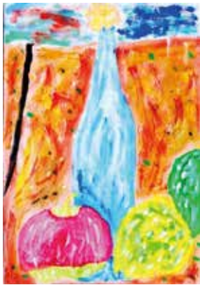
片岡 優 «静物»