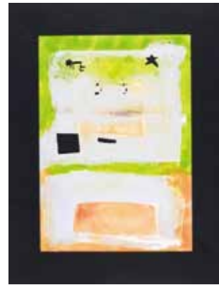
小野寺 蒼 «ロウ画「星と人」»