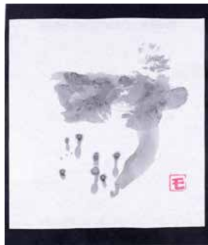
倉橋 毛毛 <「毛毛字」>