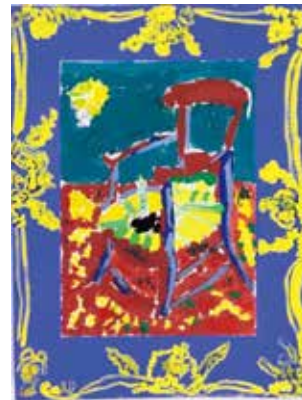
白坂 光湯里 «ゴッホの椅子»