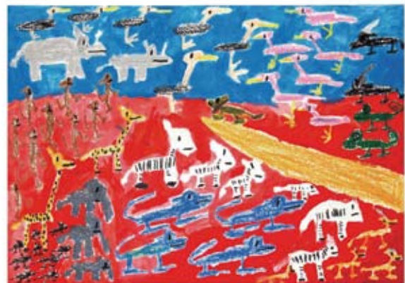
大月 優太郎 《ライオンキング》