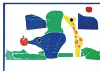
高山 伊吹 《サファリ》

※ 報告書に掲載している画像は、第 2 回東京都立特別支援学校アートプロジェクト展（平成 29 年 2 月 20 日～3 月 6 日）に展示された作品です。