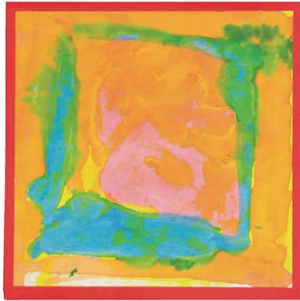
吉村 有葵 《バス》