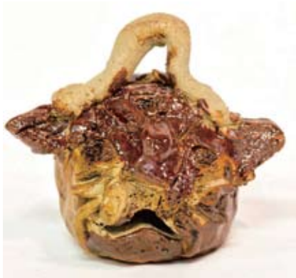
野村 朋哉 《顔の土鈴》