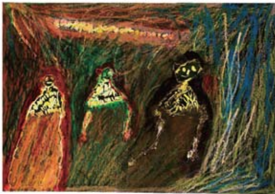
竹尾 康孝 《RIO・オリンピック》