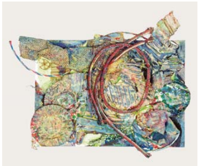
伊東 頼輝 《無題》