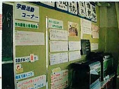
統一感をもたせるように工夫した掲示物