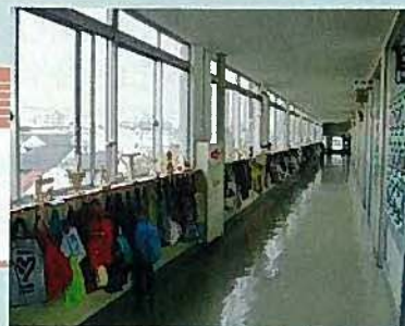
廊下に整理された道具袋