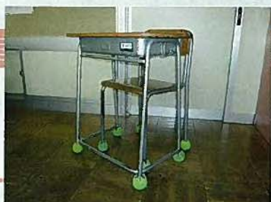
テニスボールを敷いた机といす