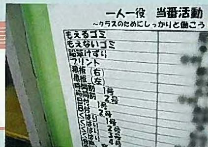
分かりやすい当番表