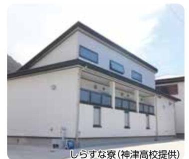
しらすな寮

※新型コロナウイルス感染症の拡大状況その他の事情により急遽中止することがあります。