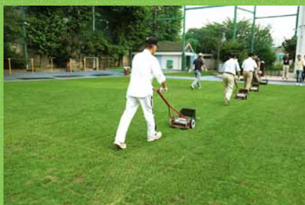
芝刈り方法に対するアドバイス

教職員やボランティア向けに、芝生の維持管理に関する各幼稚園・学校の状況に合った講習会を開催できます。