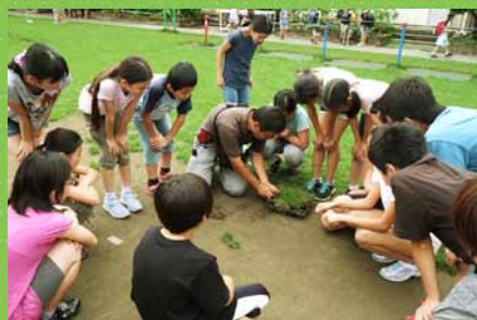
ポット苗植付けに対するアドバイス