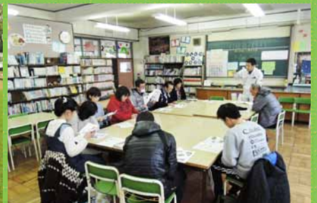
芝生委員会での説明