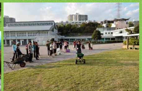
冬芝の種まき方法に対するアドバイス