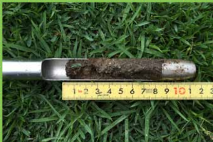
土壌の確認と診断

芝生の専門家を派遣し、各幼稚園・学校の状況に応じた助言等を行います。また芝生化1～5年目までの学校に一年に一度訪問します。