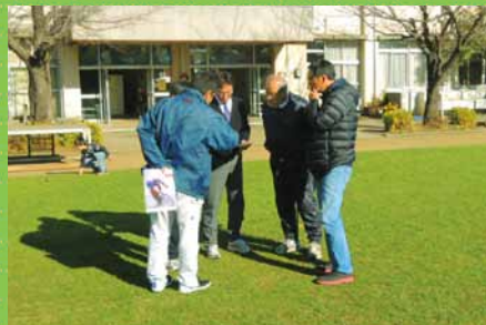
芝生の状態、対応方法の説明