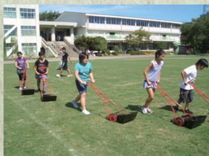
児童たちは、月・火・木・金の毎日20分間、校庭の1/4ずつ芝刈りをします。1週間で校庭全体の芝刈り完了！

武蔵野小の維持管理には、大勢の人が少しずつ関わっていることが大きな特徴です。まずは、月、火、木、金