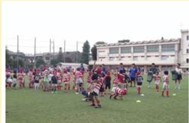
●芝生の上で楽しむラグビー体験教室