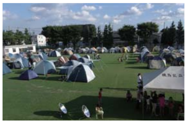
●芝生の上でお泊まりキャンプ