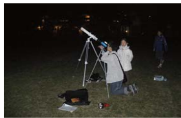
●芝生の上で星を楽しむ会