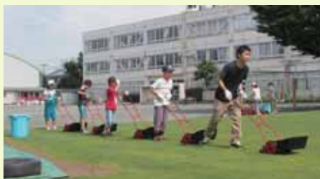
クラス作業による芝刈り