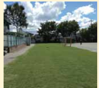
専門家から手入れの仕方を絶賛された緑の芝生(平成26年8月撮影)