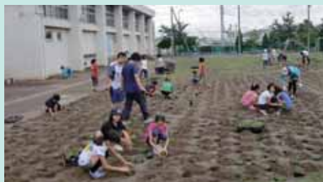
芝生の補修の様子