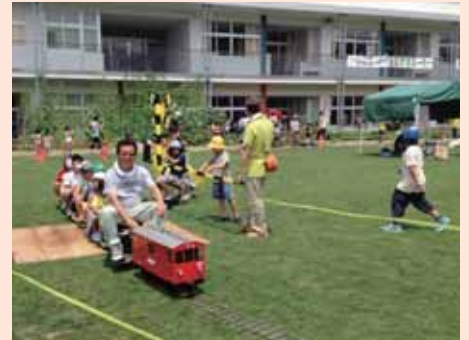
子供たちも大人も楽しい芝生でGO!