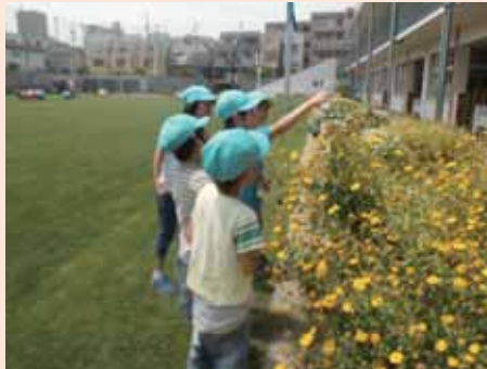
園児たちも芝生の上で積極的に遊びます

直接芝生に触れる機会を通して「地域の芝生」という意識を育むため、芝生の上をミニSLが走る「芝生でGO!」など、子供から高齢者まで参加できる多彩なイベントが続々と開かれています。小さな芝生の種が大きな地域交流の種となっています。