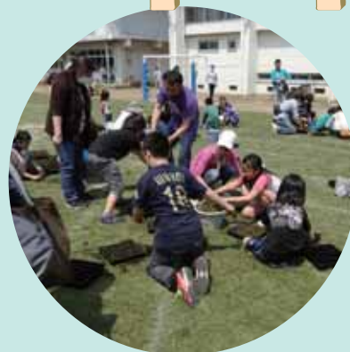
谷戸小学校のポット苗作り

家による講習会を通じて適切な管理方法を取得すること、ポット苗による芝生の補修、校庭の出入り口にロープを張り通行を分散させるなど芝生を適度に休ませる工夫を行うことです。計画を着実に実行した結果、平成26年度には、緑の校庭で運動会を行うことができました。