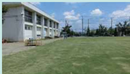
1年後には、緑の芝生が復活