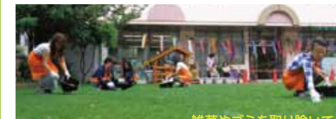
雑草やゴミを取り除いて…

部員は10人。芝刈り作業は毎週火曜日と金曜日。ゴミや雑草を取り除いてから、「ぞう」「こあら」「ろぼ」など、草食動物の名前が付いた芝刈り機で芝を刈ります。施肥、水やりなどは専門家が毎月提出する「芝生点検報告書」の指摘など（※）に従って行っています。