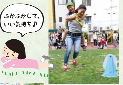
ジャングルリレー 子供を抱いて走ったり、ケンケンしたり、おんぶしたり…どんなに走り回っても足元はフカフカです。