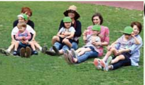
バスに乗って バス代わりのお母さんの膝の上で揺れたり弾んだり。お母さんもお尻が痛くなりません。