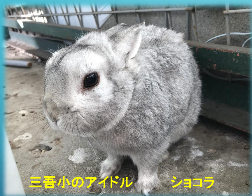
三吾小のアイドル ショコラ