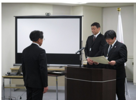
表彰状授与式の様子

村山学園では、小中一貫校特有の、教職員同士の齟齬打開の策として、大幅な組織改革を行い、「一つの学校 みんなでいっしょに」をモットーに、小中一体となった「村山学園校務システム」を構築しました。この「村山学園校務システム」